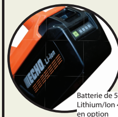
Batterie de 50V Lithium/Ion 4 Ah en option