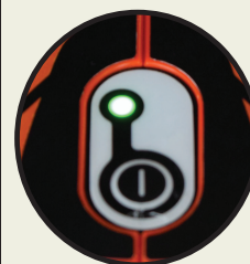
Batterie 50V Lithium/Ion Batterie de 2 Ah en standard