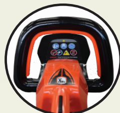
Poignée très manœuvrable